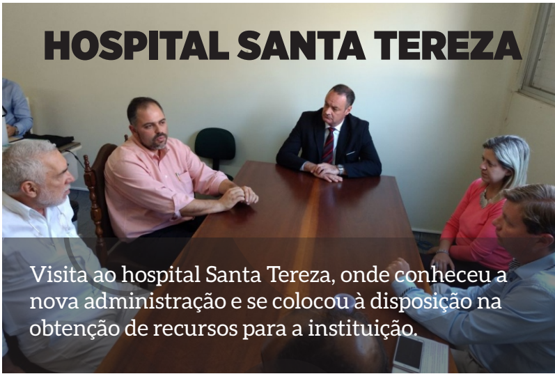
Visita ao hospital Santa Tereza, onde conheceu a nova administração e se colocou à disposição na obtenção de recursos para a instituição.