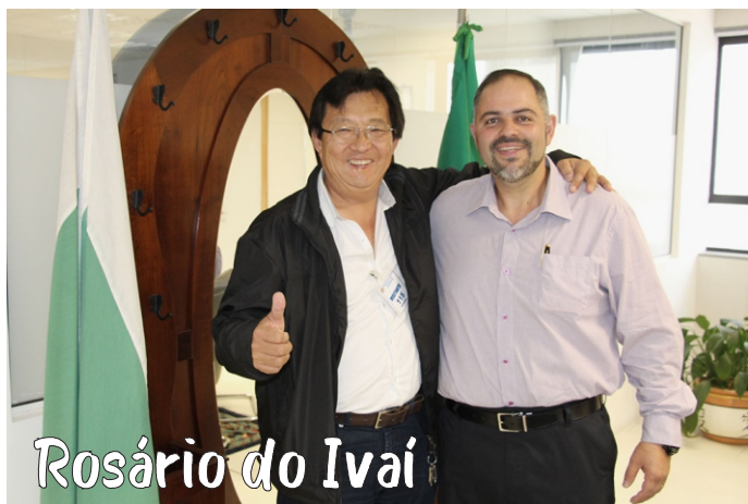
Rosário do Ivaí