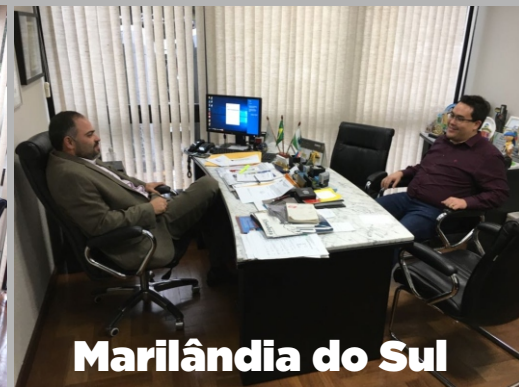
Marilândia do Sul