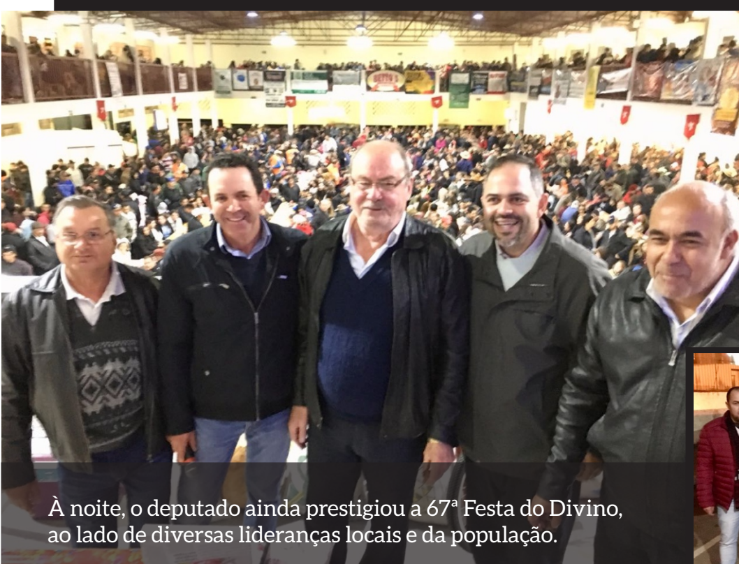
À noite, o deputado ainda prestigiou a 67ª Festa do Divino, ao lado de diversas lideranças locais e da população.

“Foi uma demanda trabalhada junto ao Governo do Estado por toda a comunidade escolar. Agradecemos à governadora Cida Borghetti e também ao ex-governador Beto Richa e ao ex-secetário chefe da Casa Civil, Valdir Rossoni, que foram os que iniciaram todo o trâmite do processo”, ressalta o deputado.