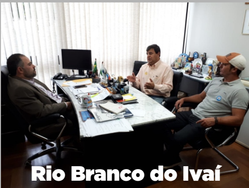
Rio Branco do Ivaí