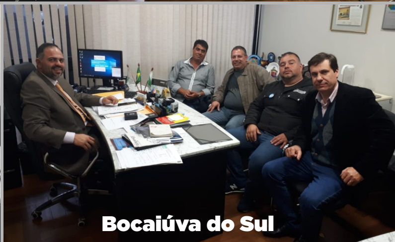
Bocaiúva do Sul