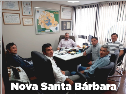
Nova Santa Bárbara