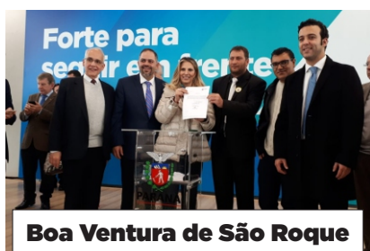
Boa Ventura de São Roque